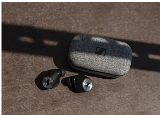
Sennheisers nye MOMENTUM True Wireless-øretelefoner sætter nye standarder for lyd kvalitet, med karakteristisk MOMENTUM-stil og komfort.